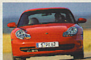
Mit Wasserkühlung: 996

Elfer-Liebhaber waren beim Anblick des 996 nicht erfreut