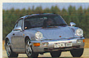
Auch mit Allradantrieb: 964

Der Porsche 964 lief von 1988 bis 1993 vom Band